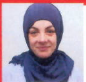
M.w. Gam Apotheek De Herenhof