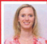
M.w. Vd Salm Apotheek Ridderveld