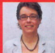
M.w. Oosterom Apotheek De Hoge Zijde