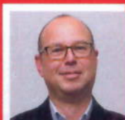
Dhr. Smith Apotheek Ridderveld