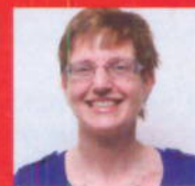
M.w. Ruitenburg Apotheek De Hoge Zijde