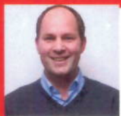
Dhr. Seesing Apotheek De Herenhof