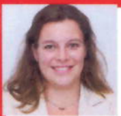
M.w. Hoogenboom Apotheek Allart