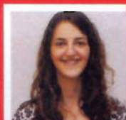
M.w. Tadayon Apotheek Ridderveld