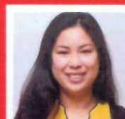
M.w. Khong De Vijver- apotheek