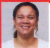
M.w. Hulst DagNacht apotheek