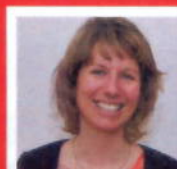
M.w. Kouwen Apotheek Ter Agr