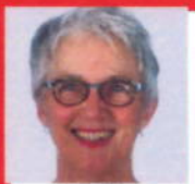
M.w. Hazelzet Apotheek Allart