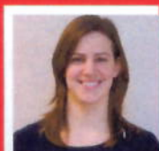
M.w. Leeuwen Apotheek Ter Agr