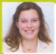
M.w. Hoogenboom Apotheek Allart