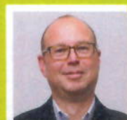
Dhr. Smith Apotheek Ridderveld