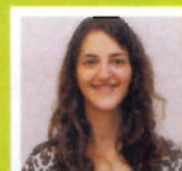
M.w. Tadayan Apotheek Ridderveld