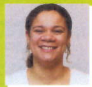
M.w. Hulst DagNacht apothek