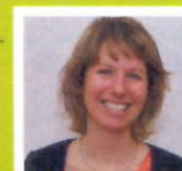
M.w. Kouwen Apotheek Ter Aar