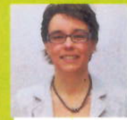
M.w. Oosterom Apotheek De Hoge Zijde