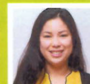
M.w. Khong De Vijver- apothek