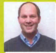
Dhr. Seesing Apotheek De Herenhof