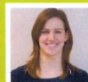
M.w. Leeuwen Apotheek Ter Aar