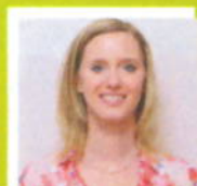
M.w. Vd Salm Apotheek Ridderveld