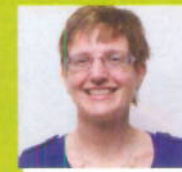
M.w. Ruitenburg Apotheek De Hoge Zijde