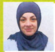
M.w. Gam Apotheek De Herenhof