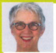
M.w. Hazelzet Apotheek Allart